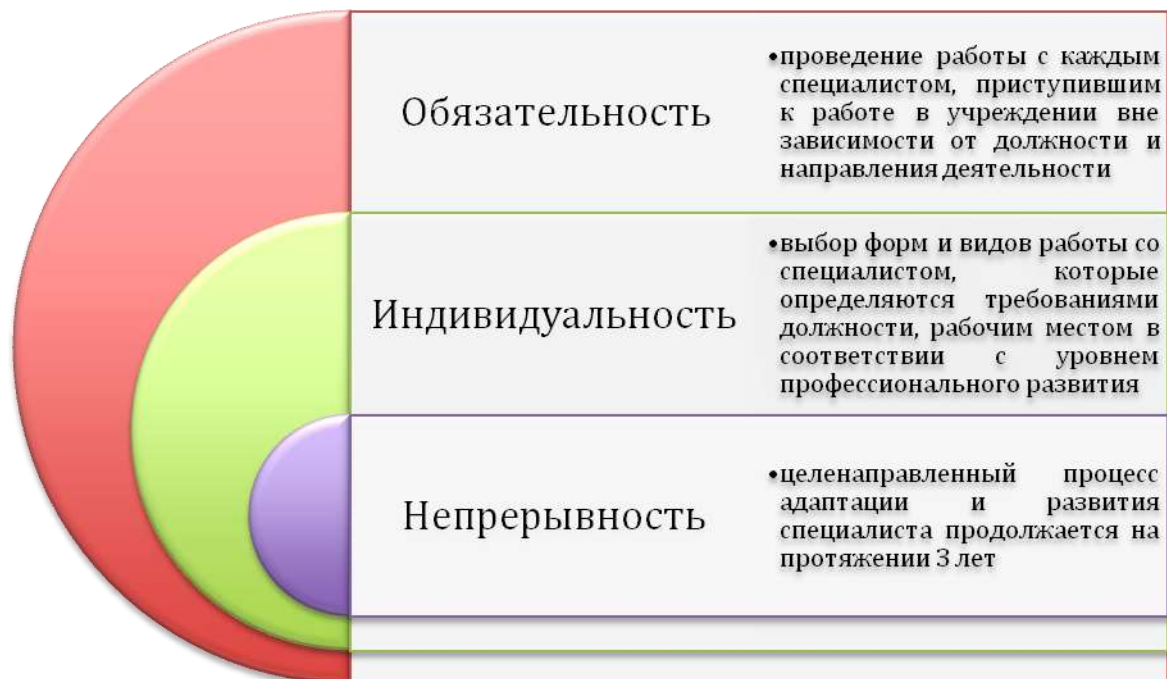
Рис.1. Принципы наставничества

Основными принципами работы с молодыми специалистами являются: обязательность, индивидуальность, непрерывность (рис. 1).