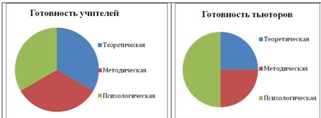
Рис. 3. Результаты диагностики готовности молодых педагогов к профессиональной деятельности

У остальных педагогов были определены различного рода профессиональные дефициты как в теоретической области, так и в методической и психологической сферах. Исходя из выявленных затруднений, были разработаны мероприятия для молодых педагогов (учителей и тьюторов) для наставнического сопровождения в течение трех лет (таблица 3).